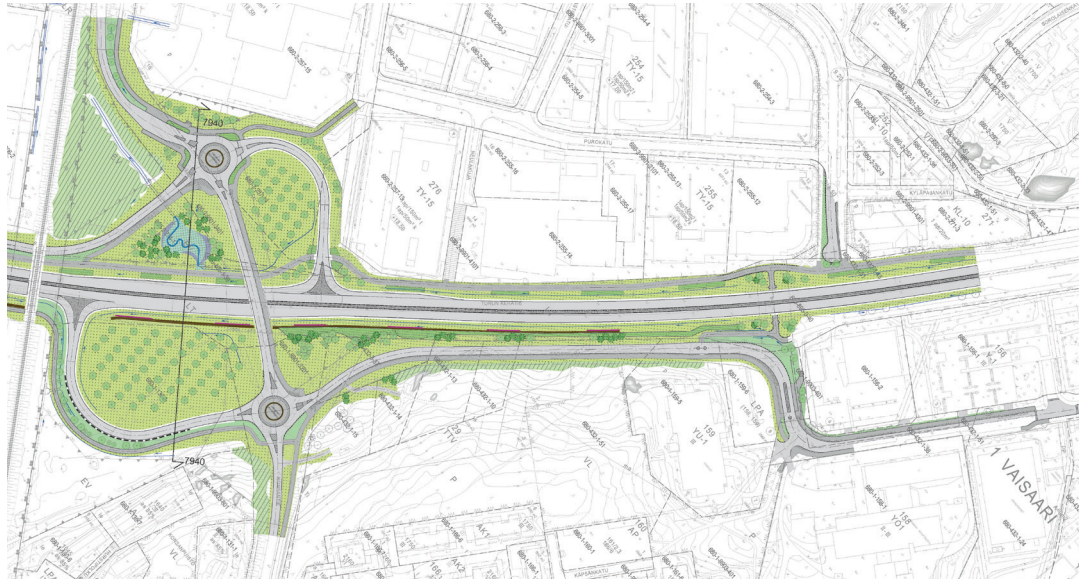
Ote tieympäristösuunnitelmakartasta 31.3.2023